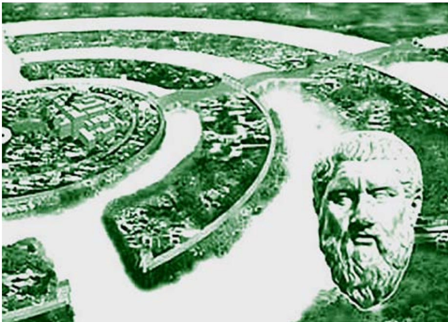
Platon beskrev en Atlantis-by omgivet af cirkulære kanaler. - Kunne det være skabt for at efterligne et kosmisk mønster i stjerneverdenen ud fra ideer om en særlig samklang - ligesom det også kendes senere fra oldtidskulturerne?

Eksempelvis var Eratosthenes forfatter, filosof og astronom, og blev 240 f.Kr. den tredje leder af Alexandrias berømte bibliotek, der rummede mængder af ældre tekster indsamlet ved kongelig befaling fra de gamle egyptiske templers biblioteker: En vidensbaggrund, hvor han også nævner Atlantis. - Og historikeren Ammianus Marcellinus (ca. 350 e.Kr.) skriver, at: "... Alexandrias intelligentsia betragtede Atlantis' ødelæggelse som et historisk faktum ...".