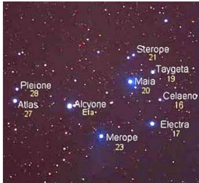
"Søstrene" navngivet, foruden andre af Plejade-området stjerner. I nyere tid er der igen - navnemæssigt - de klassiske syv stjerner.