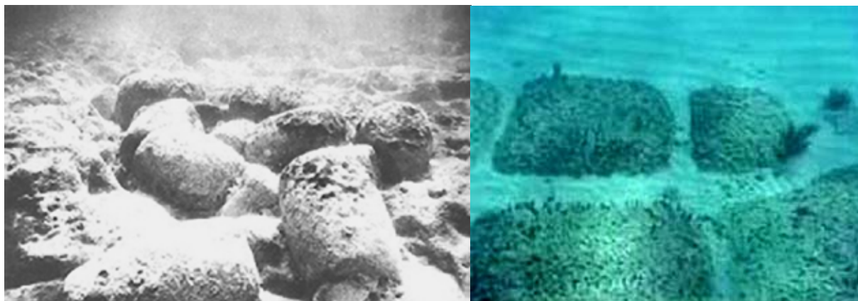
Fotos af havbund ved de vestatlantiske øer Bimini (t.v.) og Andros (t.h.) - taget 2003 af forskeren Dr. Greg Little ( www.coasttocoastam.com/shows/2005/07/26.html ). Fundet anses, bl.a. ud fra hans undervandsarkæologiske optegning (nederst), ikke for en vej, men foreslås som et maritimt anlæg.

Platon angiver desuden meget bevidst nogle eksakte mål og antal for cirkelkanalerne, de talforhold udgør tydeligt en slags kode - dvs. en viden han videregiver og ikke bare "en myte".