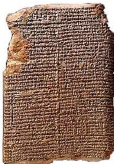
Mul-Apin stjerne- og himmelfænomen-fortegnelsen fra Babylon. Brændt lertavle med kileskrift, ca. 650 f.Kr.

Ligesom i de meget gamle kulturers beskæftigelse med stjerneverdenen var også metals bearbejdning altid sat i forbindelse med deres religiøse verden. En forgrening førte til alkymi. I kobbermineområdet på Sinai havde egypterne bygget et tempel for himmelgudinden Hathor og Sirius-stjernen. Måske vil en oldtidshelligdom også kunne findes i de rumænske bjerge.