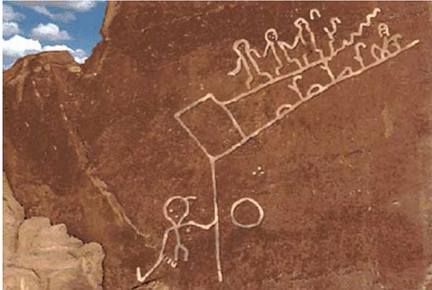
En af Hopi-indianernes magiske inskriptioner med varsler, på Prophecy Rock i Arizona, bl.a. om "den blå stjerne Kachina (Sirius)" og dens "signaler".