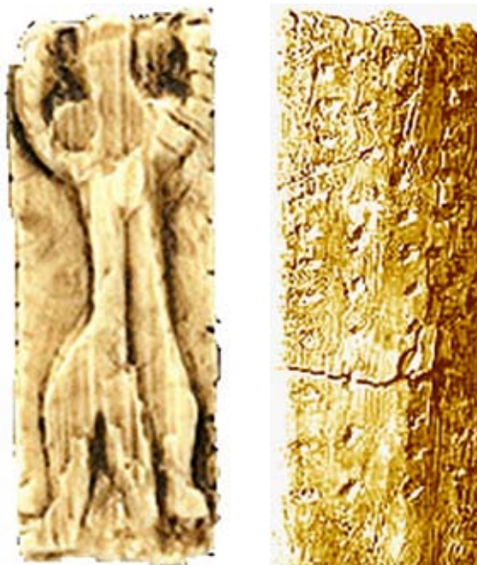
Stjernebilleder hos fortidsfolk. - T.v.: Orion, for 33.000 år siden, udskåret i mammuttand.

hvad en række interessante indicier synes at bidrage til at tydeliggøre, ville man dengang uundgåeligt have bemærket sammenfaldet af de to stjernerelaterede aksers positioner. Dette i en æra, der således forløb simultant med Atlantis-kontinentets kataklysmiske destruktion, hvilket man ville have anset som afslutning på en verdens-æra og starten på en ny cyklus.