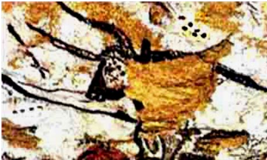
Hulemaleri fra Lascaux-grotten - viser Tyren og Plejaderne - og Hyaderne til venstre - alle i korrekt position for 16.000 år siden.

Desuden er der blevet påvist en dobbeltbetydning af systemet med de 87 hulninger eller hak. Nemlig det antal af dage der fratrækkes et års 365 dage for generelt at angive en graviditetsperiode, en metode der endnu ses i brug så sent som i 1800-tallet. Desuden, på oprindeligt var Orions to mest markante stjerner usynlige i 87 dage om året - set fra den lokale breddegrad ved Donau, hvor himmeloptegnelsen blev fundet, hvorimod i Middelhavsområdet i syd ville antallet af dage være færre. Disse data er bl.a. offentliggjort i "Science", 7. Feb. 2003 (vol. 299, no. 5608, p. 817).