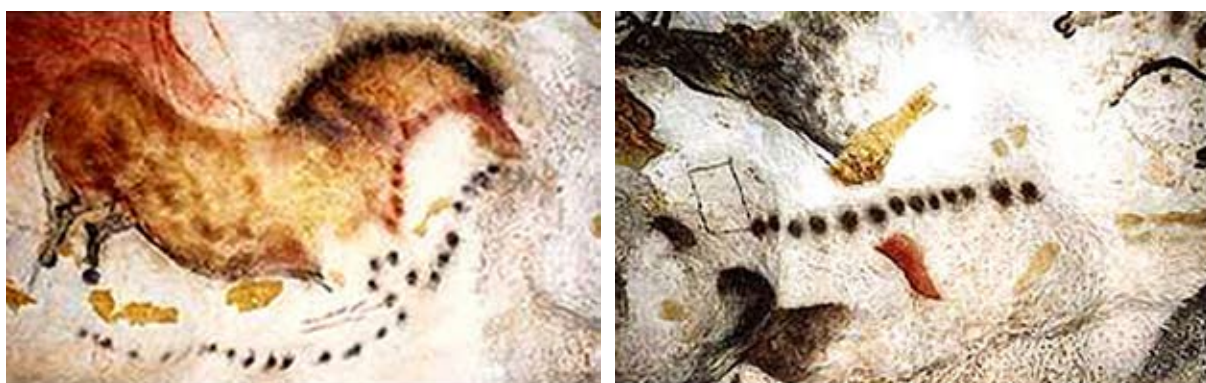
Lascaux-hulemalerier med astronomiske data. T.v.: En månekalender indsat. T.h.: En halv månecyklus og en tom firkant.

Ligeledes himmelkundskab og religiøs initiering hang altid ubrydeligt sammen. Lascaux-grotten med disse hulemalerier har været anvendt til initieringsritualer og magiske formål - der er ingen spor af direkte beboelse, f.eks. fra de folk, der fremstillede malerierne.