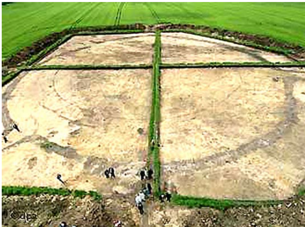
En enorm cirkelflade findes udbredt midt i de flade hvedemarker nær Goseck i Tyskland. Anlægget præsenterer resterne af verdens hidtil ældste stjerneobservatorium - en alder af 7.000 år.

Den nævnte bondekaltenders regler om Plejaderne var naturligvis gældende hele tiden - og dermed også længe før grækerne. I dag ved vi, som nævnt, at landbrugskultur kendtes langt, langt tidligere end hidtil antaget.