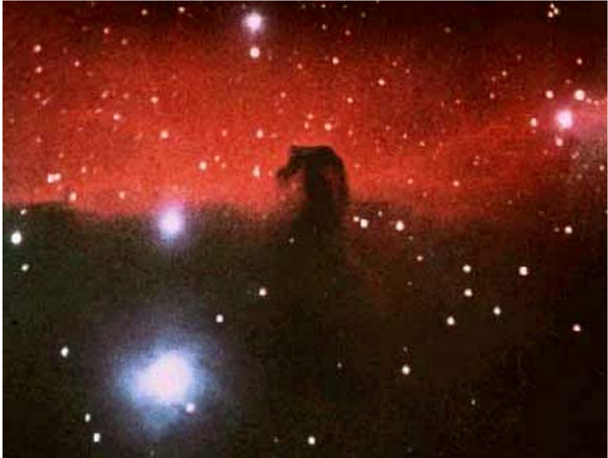
Hestehoved-stjernetågen - findes i stjernebilledet Orion.

Kurma-nadi (skildpadde-'nerven' - kirtlen) beliggende i brystet under svælget. En 'psykisk nerve', der anses at forekomme virksom hos dyr (bjørnen, f.eks.), der går i hi og overvintret i ubevægelig tilstand.